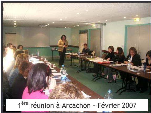
1 ère réunion à Arcachon - Février 2007