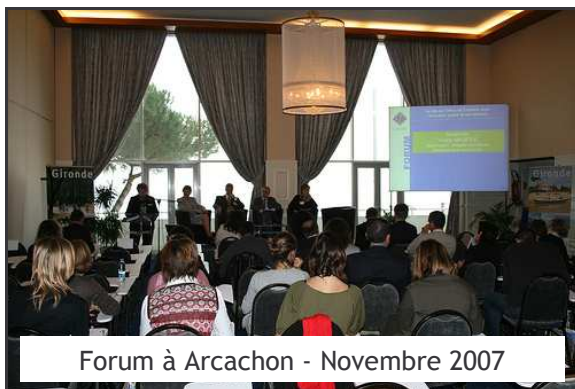
Forum à Arcachon - Novembre 2007

100% des 15 actions prévues sur le Pôle qualité de l'UDOTSI Gironde ont été réalisées. (une action annulée)